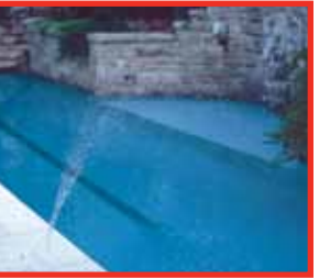
Rociador en abanico

Los primeros juegos de agua fueron diseñados para uso comercial y, luego, se adaptaron para uso residencial. Esto dio como resultado la sobre ingeniería del producto y precios elevados. El chorro para efectos de agua para plataforma de Pentair Water Pool and Spa™ está especialmente diseñado para uso residencial, y utiliza materiales de construcción y técnicas de fabricación que permiten tener costos reducidos. La construcción de las partes clave hecha totalmente en plástico reduce los costos iniciales y de vida útil del sistema, y al mismo tiempo ofrece una operación sin problemas con mínimo mantenimiento o sin necesidad de mantenimiento.