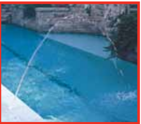
Chorro simple de 1/4"