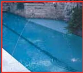
Chorro simple de 3/16"